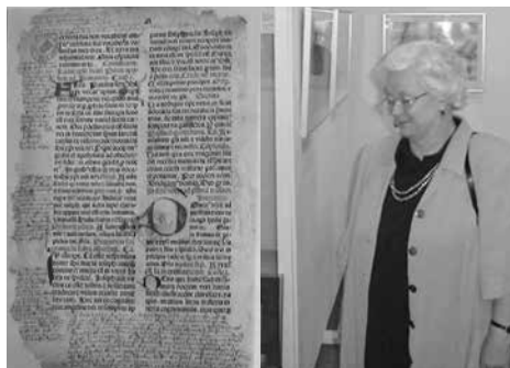
Ausstellung zur Präsentation des Missale Slesvicense

Für die Nordelbische Kirche hat sie unersetzliches Archiv- und Bibliotheksgut restauriert, von dem hier nur einige Beispiele genannt werden sollen. Vor allem seien das Rendsburger Fragment der Gutenbergbibel (1452 -1455), das von 1997 bis 1999 restauriert wurde, die Inkunabel „Missale Slesvicense“ aus dem Jahr 1486, die sehr aufwändig in den Jahren 2000 bis 2002 restauriert wurde und die „Wöhrdener Bücher“ (16. und 17. Jahrhundert), die in einem länger angelegten Projekt von 2002 bis 2012 restauriert wurden, genannt.